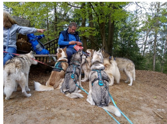
Hunde freuen sich über den Stopp ☺

Ab jetzt ging es ans Eingemachte. Die großen, von Sturmschäden geräumten Wege waren passé, es durfte geklettert werden. Und zwar bergab und über umgekippte Bäume! Vom Paul-Roth-Stein herunter haben wir erstmal andere Wanderer ziehen lassen, denn es schien ein Kettensägemann auf uns zuzukommen. Da wir aber kein Schreien oder Wehklagen hörten, stiegen auch wir mutig bergab. Fast am Ende der Steige dann des Rätsels Lösung: ein Harvester ging seiner Arbeit mit ordentlich Getöse nach. Also weg hier und auf zum nächsten Gipfel: Dem Hasselbrack! Der Hasselbrack in den Harburger Bergen ist mit 116,2 m ü. NN die höchste natürliche Erhebung in Hamburg! Er liegt genau an der Grenze zu Niedersachsen.