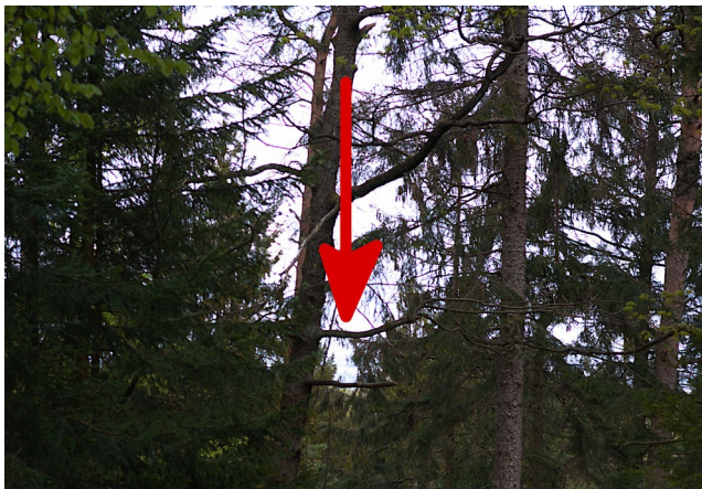
Blankenese ist nur zu erahnen

Dennoch, genügend Bäume sind noch da, um den Blick über die Elbe nach Blankenese nur erahnen zu lassen!